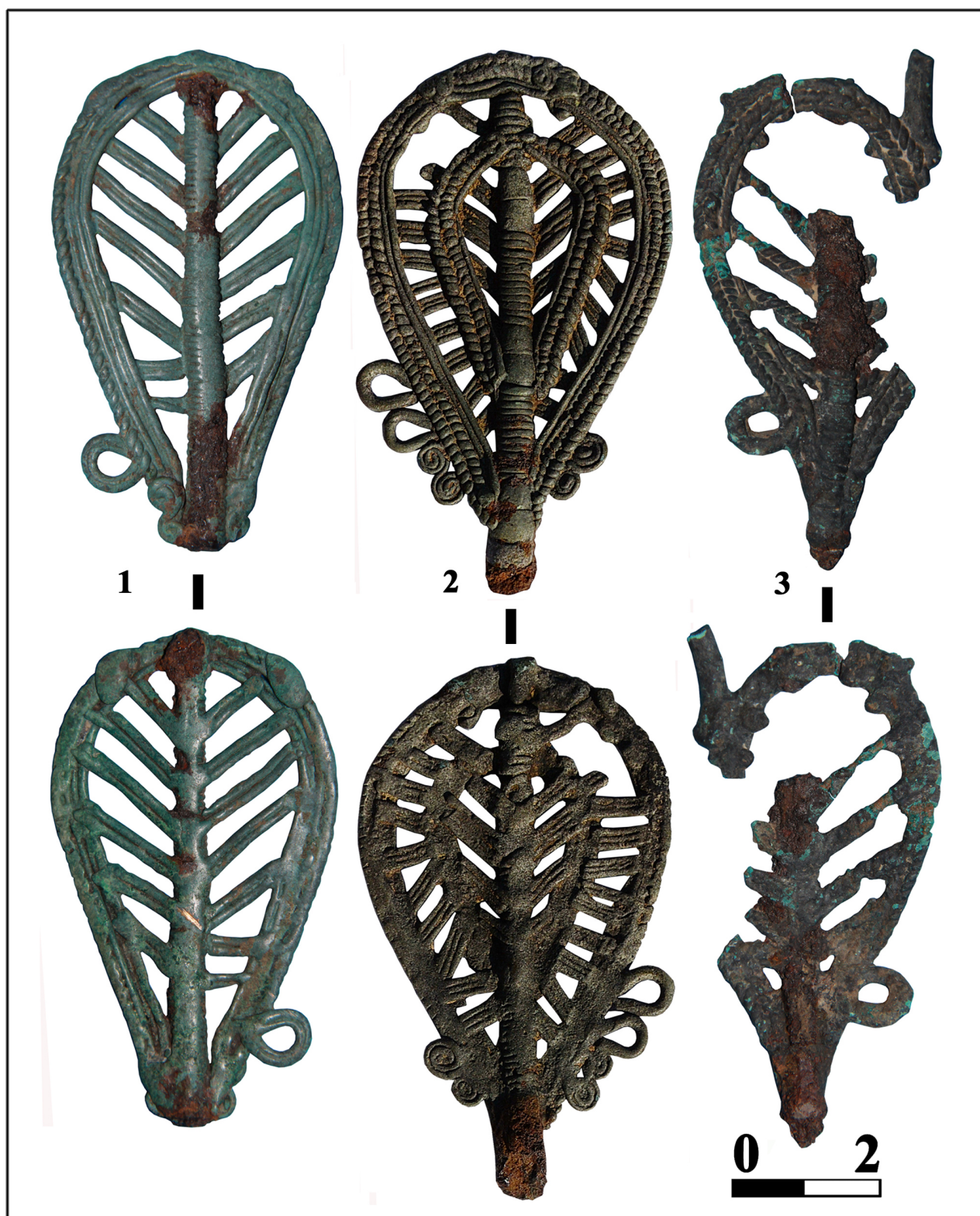
Рис.3 1-3 – Львовский район.