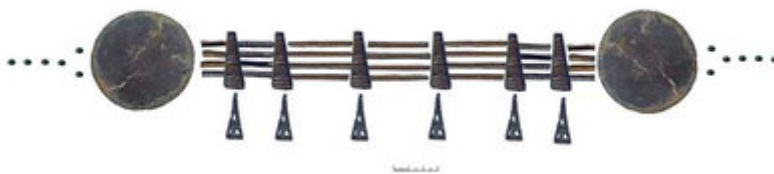
Рис. 3. Возможная реконструкция расположения металлических компонентов венчика-вайнаги из Дятково.

Выводы. Обнаруженный близ Дятково «клад», по всей вероятности, является металлической частью сложного женского головного убора-венчика. Венец из Дятково можно считать одним из древних прототипов раннесредневековых венцов балтских и, затем и финно-угорских племен. Скорее всего, находка носит votivный характер и была преднамеренно утоплена в озере в качестве жертвы. Клад-ларчик (хранилище) или клад, выпавший в форс-мажорных обстоятельствах (сокровище) не могли быть преднамеренно помещены на торфяное дно озера, ибо исчезала возможность последующего возвращения сокровища в оборот. В связи с этим следует вспомнить, что именно как votивные клады в настоящее время рассматриваются и раннесредневековые «клады антов», ранее считавшиеся личными сокровищами, выпавшими по различным причинам [13]. Речь может идти о так называемой «водной жертве» или «болотной жертве» водным духам, божествам [14], причем девичий головной убор мог выступать в роли заменителя реальной человеческой жертвы – замена персоны её символом. Водные жертвы бронзовых предметов в лесной зоне – от Померании и Восточной Пруссии до Верхнего Поднепровья во второй половине I тыс. до н.э. могут быть результатом кельтского культурного влияния на местное население [15].